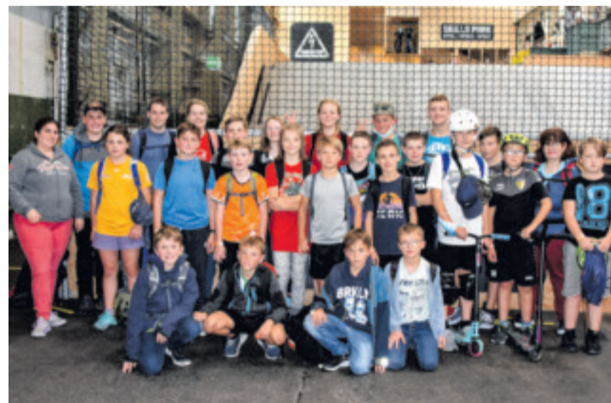
Die Jugendlichen hatten einen tollen Tag im Skills Park Winterthur.