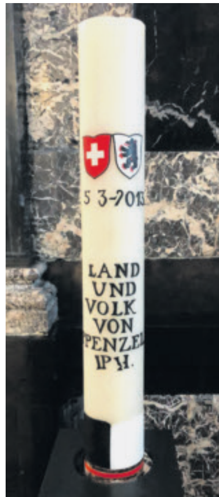
Die Appenzellerkerze in Einsiedeln, welche jeweils anlässlich der Landeswallfahrt angezündet wird.

Die Kinder haben einen eigenen Bus und ein spezielles Programm, bei der Eucharistiefeier sind sie mit dabei. Sie werden von Religionslehrpersonen betreut.