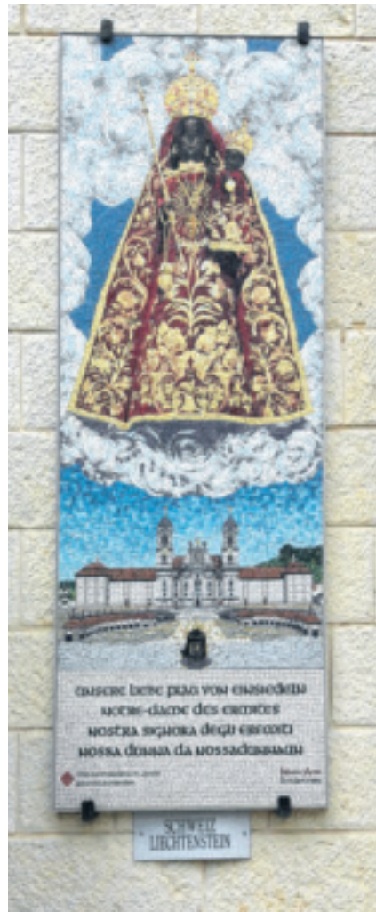
Bei der Verkündigungsbasilika in Nazareth sind Bilder vieler Marien-Heiligtümer aus aller Welt, so auch aus Einsiedeln.

Ich freue mich, wenn Sie sich die Landeswallfahrt vormerken und grüsse Sie herzlich. Lukas Hidber, Standespfarrer